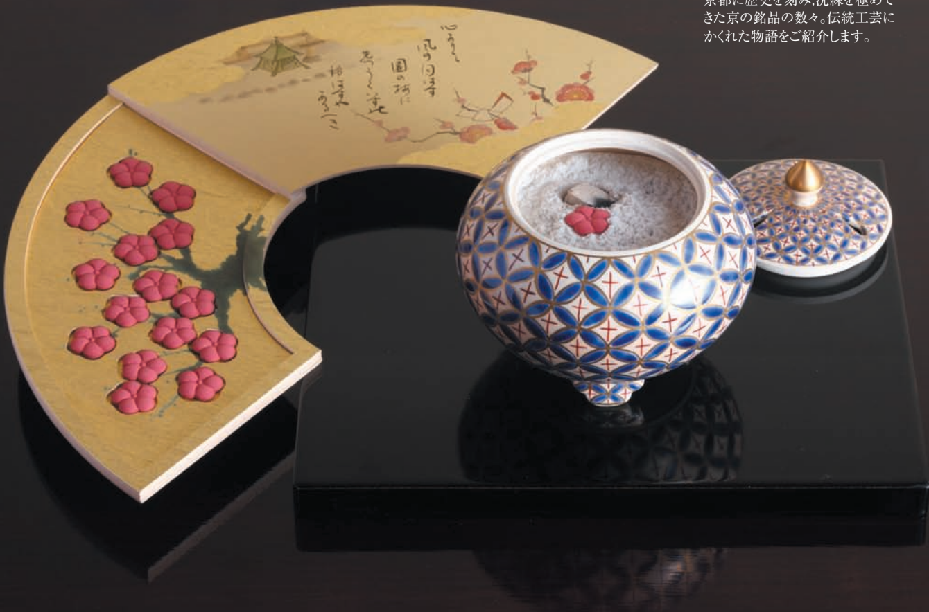
源氏物語の五十四帖を香りで綴る「源氏かおり抄」。四十三帖の「紅梅」は圧縮成型法で作成する。新しい技術で生まれた繊細な形から、伝統的な香りが漂う。

京都に歴史を刻み、洗練を極めてきた京の銘品の数々。伝統工芸にかくれた物語をご紹介します。