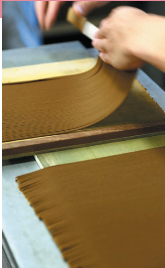
盆板上の線香をすき間なく敷き詰める。素材がやわらかいため、繊細な力加減が求められる。