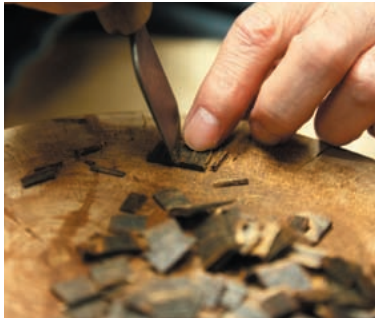
職人によって丁寧に割られる香木は、仏事や茶席などで用いられる。