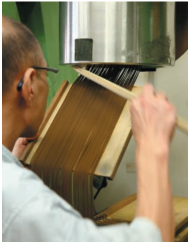
押し出し・盆切りの様子。切り落とした素材はもう一度機械に戻され、ロスをなくしている。