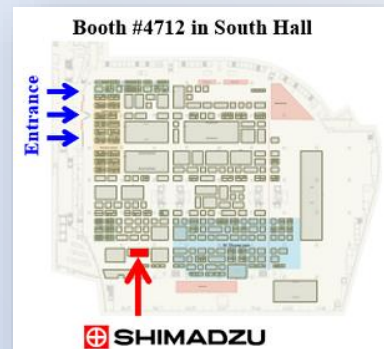
実展示 島津ブース マップ

平素より格別のご高配を賜り厚く御礼申し上げます。 米国シカゴにて開催される世界最大の放射線学会RSNA の付設展におきまして、弊社は“Making Possibilities Happen, Together”をテーマに最新システムの数々を 出展いたします。高度な画像処理ソリューションと独自の アプリケーションを多数ご用意し、臨床的な可能性お よび生産性の向上についてご紹介いたします。 弊社のブースに是非ともご来臨賜りたく、心よりお待ち 申し上げます。